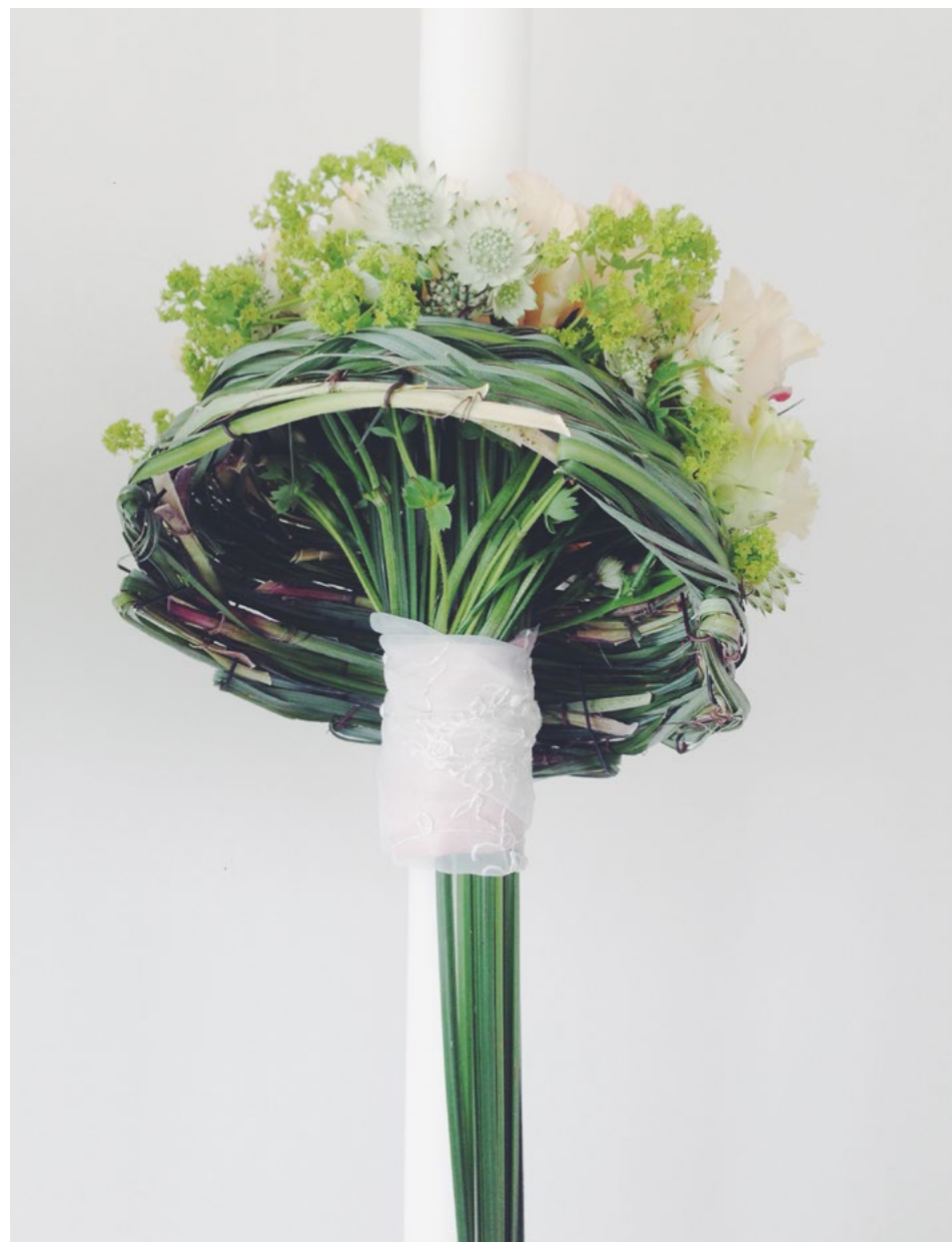
Lumânare umbrelă, H 70 cm, 355 lei/buc